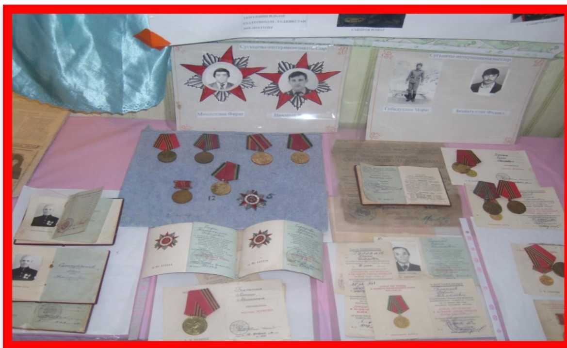
Авылдашларыбызның сугыш батырлықлары өчен бүләкләр.