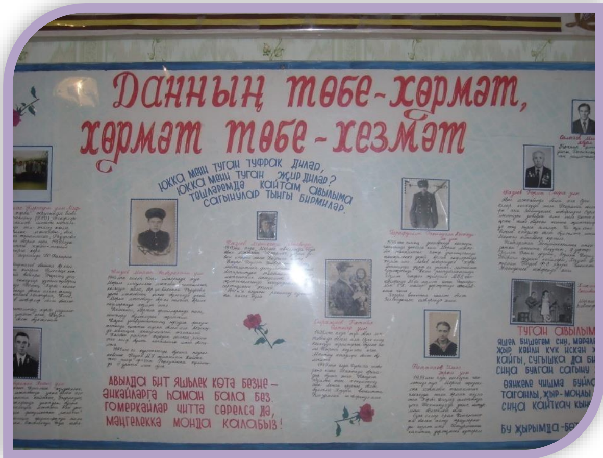
“Мәктәбем- яшылек чорым” экспозициясендә төрле чорларда мәктәп статусы һәм анда эшләүче укытучылар турында мәгълүматлар урын алган.