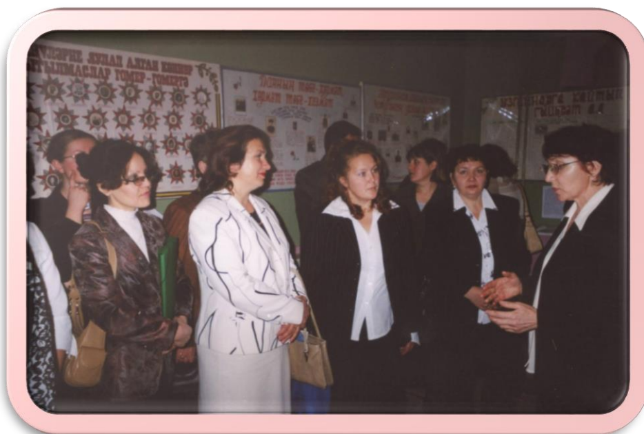
“Белем бирүне модернизацияләү шартларында предметны укытуның инновацион үсеше” темасына үткөрөлгән зона семинарында катнашучыларга музейда экскурсия.