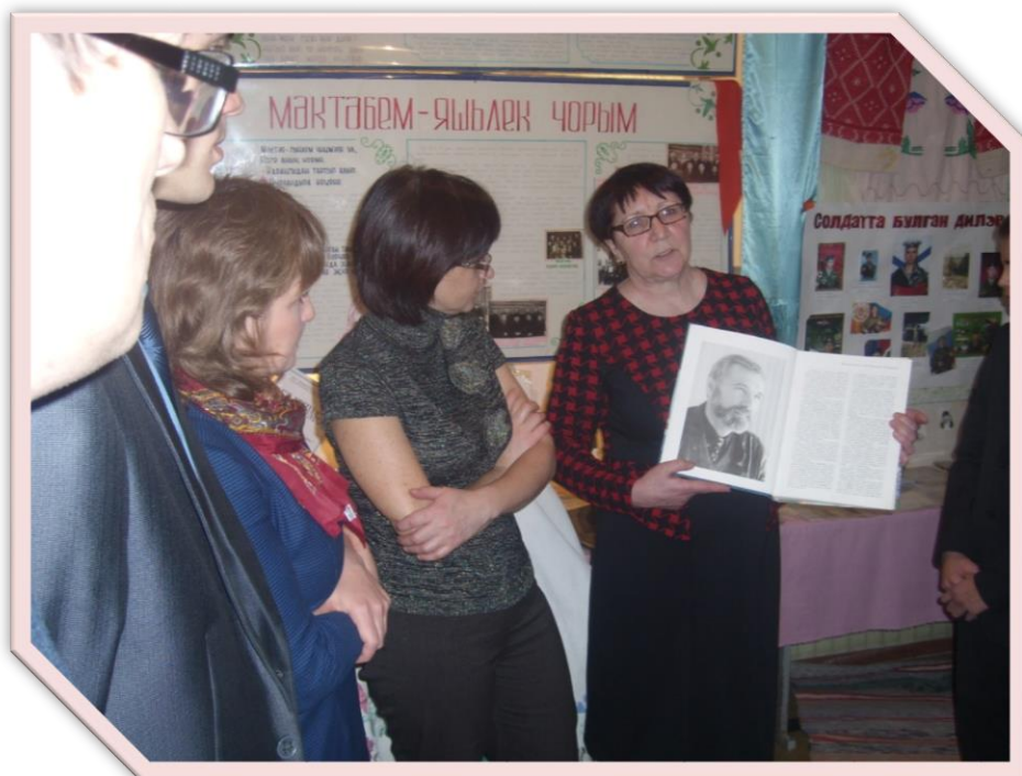
“ФГОС ка күчү шартларында гражданлык-патриотик тәрбияне оештыру” темасына багышланган тарих укытуучыларының район семинары.